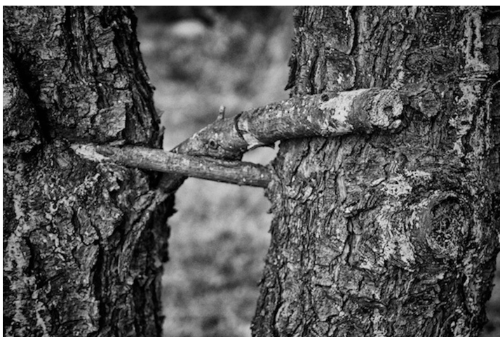
"Pins maritimes, Porquerolles, 2013