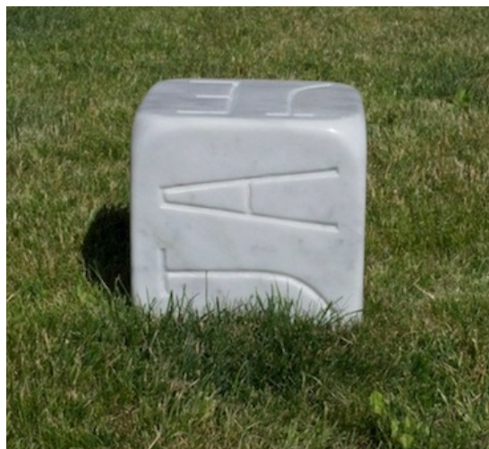
You&I (je,ja,ti,...) gravure sur marbre blanc de carrare, 2013. 20x 20 x 20 cm. édition 1